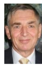
Jean-Paul LANGLOIS Président de l'IMdR

Cet institut (l'ITésé) qui regroupe une vingtaine de chercheurs, ingénieurs et économistes pour effectuer des comparaisons multicritères entre systèmes énergétiques depuis la source primaire jusqu'au besoin final. L'objectif est d'éclairer l'orientation des programmes du CEA en identifiant les perspectives offertes par les différentes technologies. En juillet 2009, il est élu président de l'Institut pour la Maîtrise des Risques (IMdR).